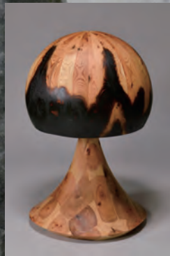
『魂のゆらめき』 関谷 駿