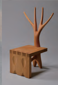
『樹跡』 中根 啓