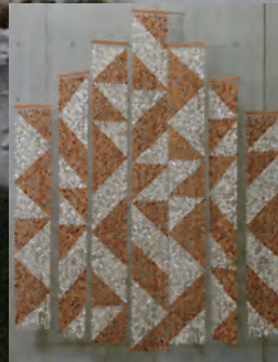
『縄文の樹』 録澤 壽雄