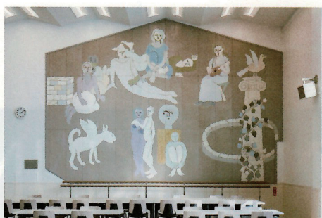
慶應義塾大学学生食堂壁画《デモクラシー》1949 撮影：木奥恵三 2025