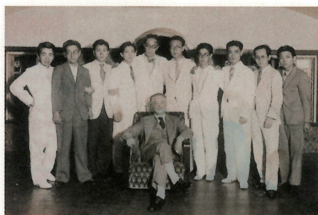
新制作派協会創立会員 1936