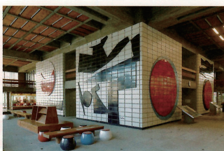
香川県庁舎東館ロビー陶画《和敬清寂》1958 2025