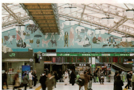
JR上野駅中央改札壁画《自由》1951 2025