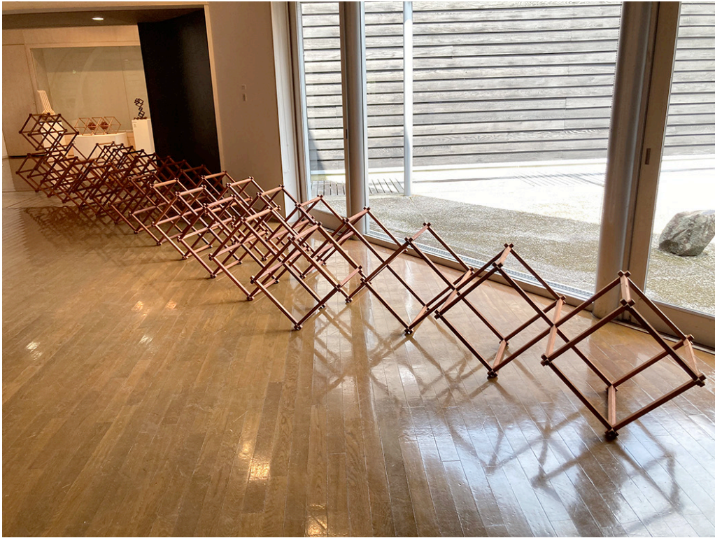
組む箇所の数にだけこだわった本作品（写真3）は、300本の角材を1000箇所の四方十字組手で組み上げています。 【写真3：cubeforest1000】