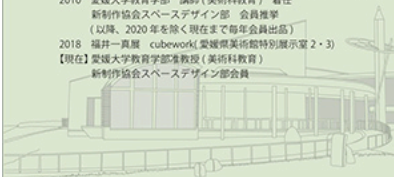
高松市塩江美術館 Shirogane Art Museum