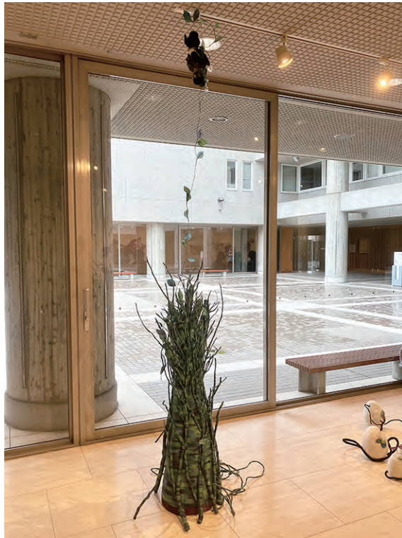
《風のおくりもの》 W70×D60×H300 不織布、発泡スチロール、木、針金他

生物とそれをとるまく環境が変化しています。それでも生命は健気に息づき、循環しています。新芽が芽吹きやがて大きな木に成長していく様子を不織布の密度や厚みを生かして表現しました。