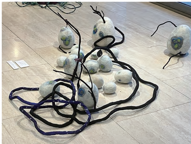
《月を待つ》 W160×D60×H40 フェルト、不織布、針金他

生物とそれをとるまく環境が変化しています。それでも生命は健気に息づき、循環しています。新芽が芽吹きやがて大きな木に成長していく様子を不織布の密度や厚みを生かして表現しました。