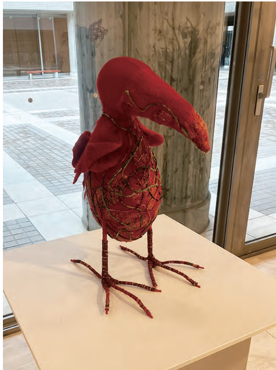
《赤の記憶》 W315×D32.5×H50 原毛、刺繍糸、パンヤ、針金他