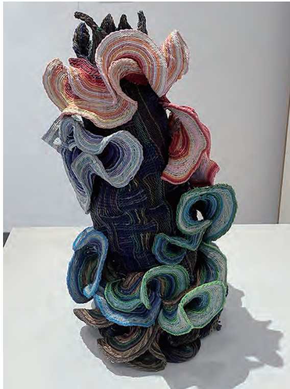
《きのこ》 W24×D24×H49 レーヨン糸