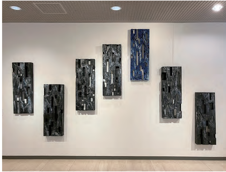
《空気の奏で》 W300×D5~10×H300 紙