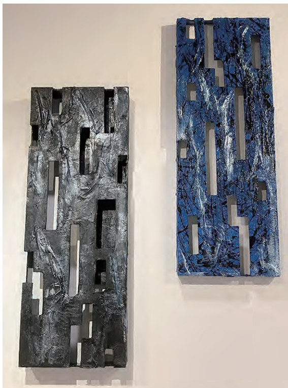
《空気の奏で》 ディテール