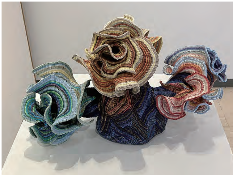
《きのこ》 W50×D50×H30 レーヨン糸