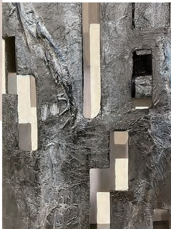
《空気の奏で》 ディテール