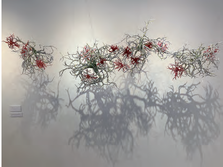
《ニューロン》 W180×D30×H80 レーヨン糸