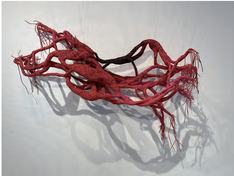
《ニューロン》 W102×D36×H86 レーヨン糸