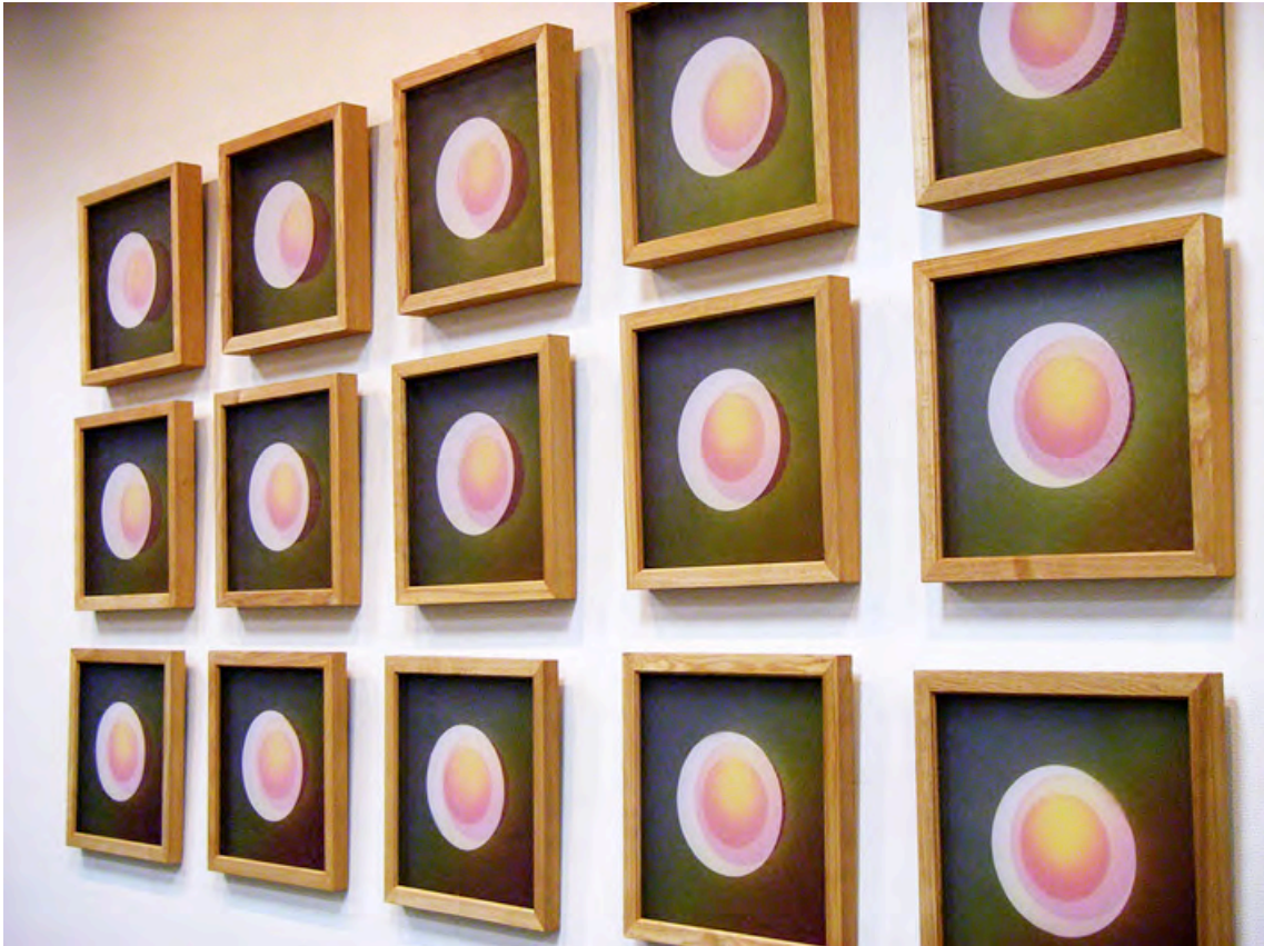
「ヌクモリ」第70回新制作展（2006年）各 H450×W450 素材：シルクオーガンジ、綿布、染料

薄い生地、透ける生地も染色の特徴と考え、その重なりによる色の表現に染色ならではの美しさを確認しました。染料による柔らかく、優しい色の表情を研究していこうと決めた作品です。