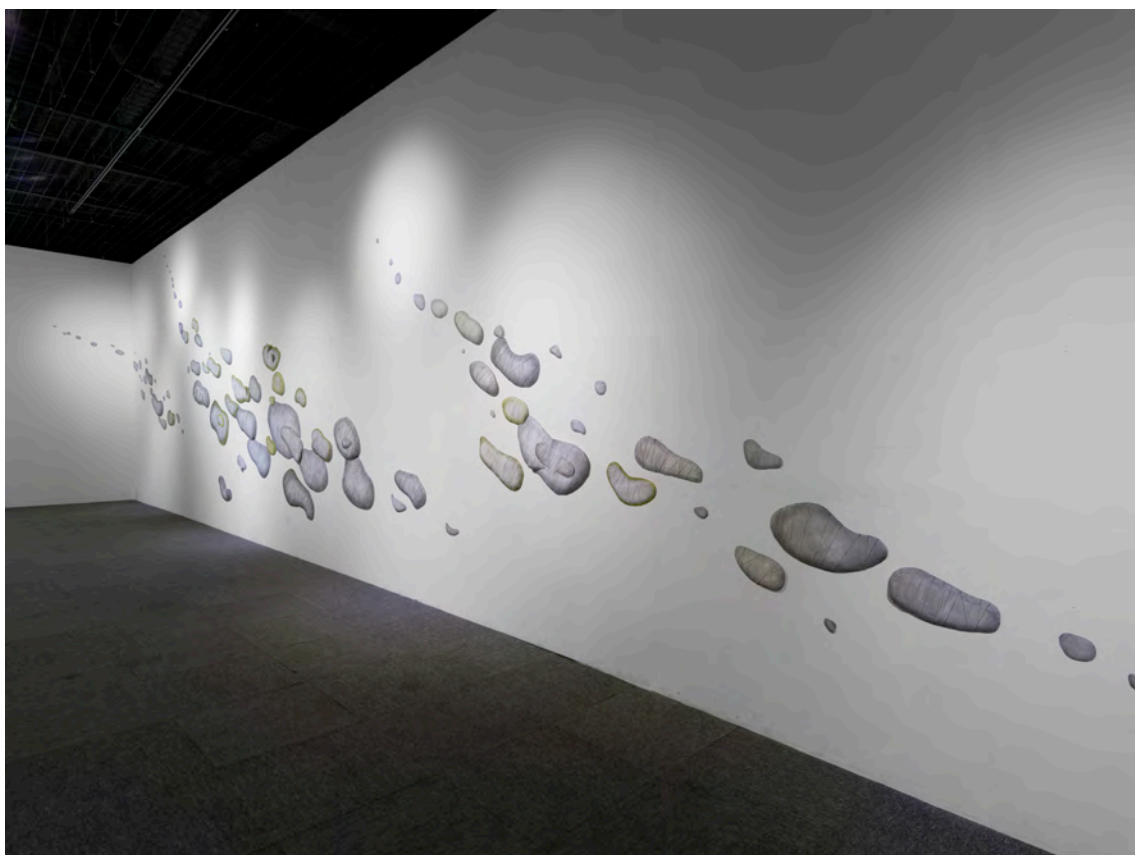
“GENESIS” 2015年 w/1200 h/250 d/10cm 個展（入谷画廊／東京）

真綿の作品を15年余りつづけるうち金網に出会う機会があり、織物でもある金網に糸を巻き、紙を貼って鉛筆でフロッター ジュしたピースで作品をつくるようになりました。植物の芽吹き、アメーバや細胞の発生、増殖、雲や山、島の発生など、 自然界の不思議に魅かれます。これは個展の作品「GENESIS」創世記で、世界のはじまりをイメージしています。