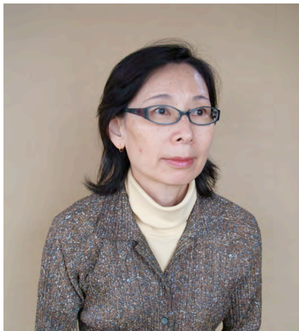
女子美術大学 産業デザイン科 工芸専攻 卒業