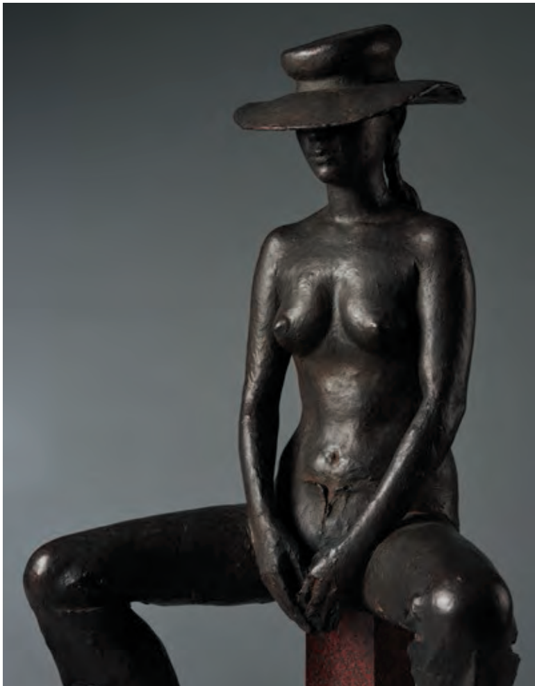
《帽子・夏》(部分) 1972年 ブロンズ