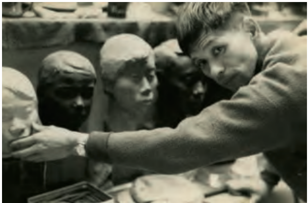
上 《群馬の人》制作中 1952年 下 代々木上原のアトリエにて1960年代頃

日本の具象彫刻を代表する作家、佐藤忠良（1912-2011）。フランス近代彫刻に魅せられ東京美術学校（現・東京藝術大学）で彫刻を学んだ佐藤は、新制作派協会（現・新制作協会）に参加し若手彫刻家として注目を集めます。従軍と過酷なシベリア抑留を経て復員した1948年以降は、社会における芸術の役割とは何か、なぜ人は人間の姿を描き作るのかを自らに問いながら、一貫して具象彫刻の道を歩みました。また、力強く現実感をたたえた素描力を生かし絵本や挿絵の仕事でもその名を残しています。