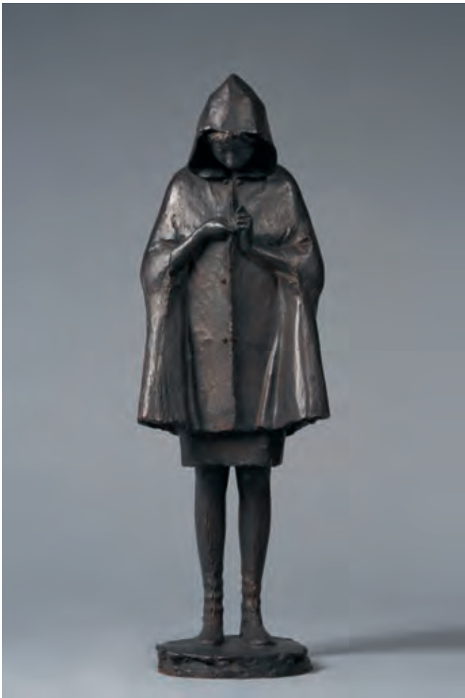
《ボタン(大)》1967-69年 ブロンズ