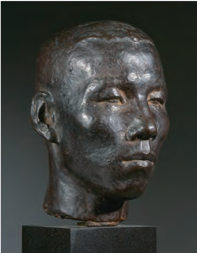
《群馬の人》1952年 ブロンズ