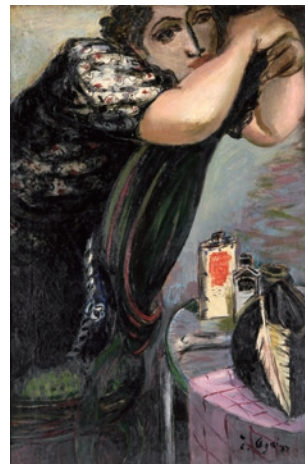
荻太郎《椅子による女》

本展では、当館収蔵の初期から晩年にかけての作品と関連資料を併せて展示し、生涯人間をテーマに制作し続けた画家のまなざしを展観します。