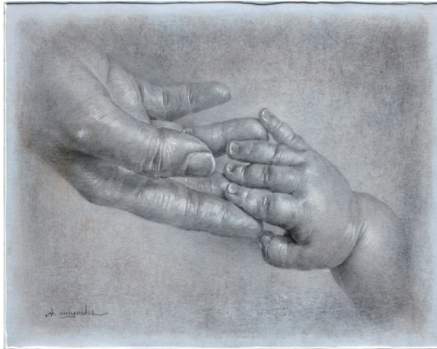
宮地明人「繋ぐ」ケント紙・鉛筆・アクリル、SM号