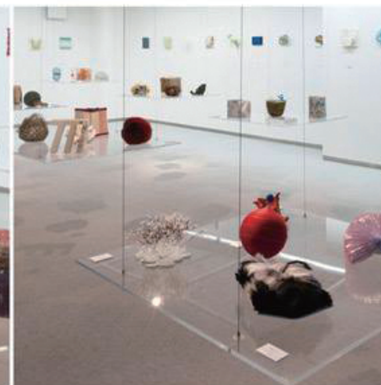
第4回展 2015年9月25日―10月3日 Gallery5610