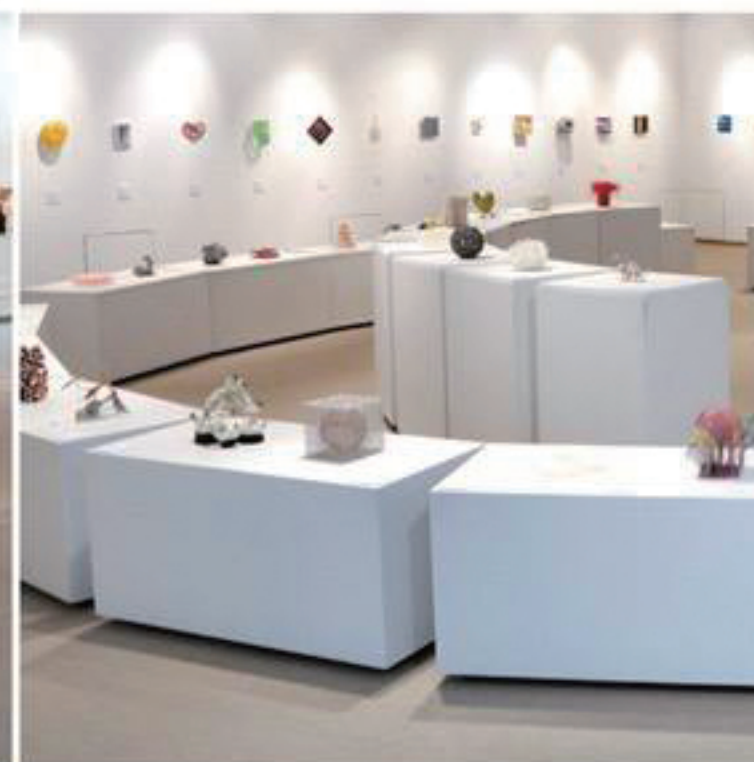
第3回展 2013年6月15日―7月7日 伊丹市立工芸センター