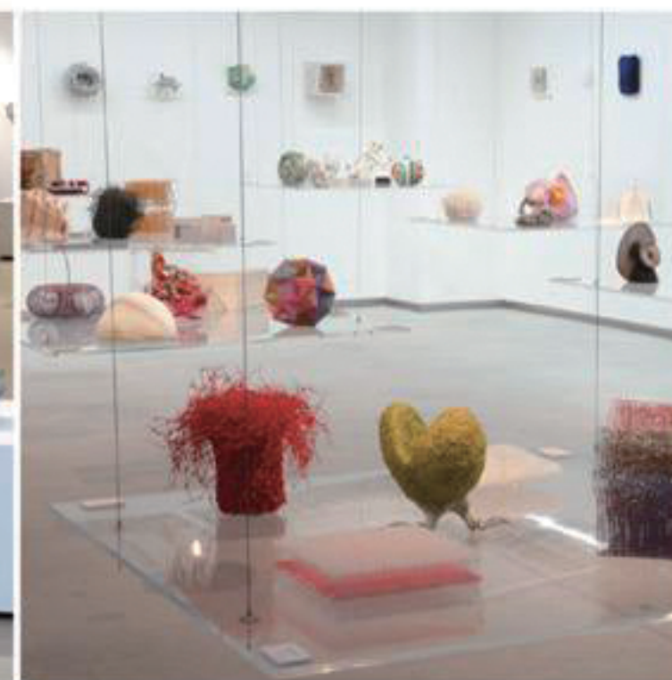
第3回展 2013年7月12日―20日 Gallery5610