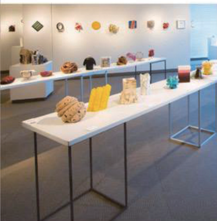
第1回展 2010年2月25日―3月9日 玉川高島屋S・C ルーフギャラリー