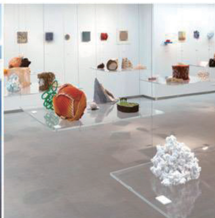
第2回展 2011年11月11日―19日 Gallery5610