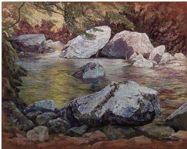
SLOW FLOW F30