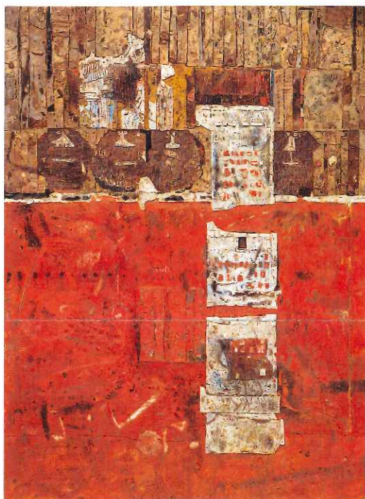
赤い墓標 [1962 194.0×117.0cm]