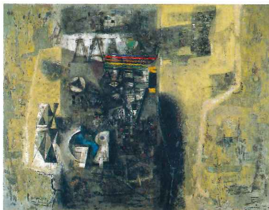
バス八近く(復活祭の頃) [1958 130.3×162.1cm]