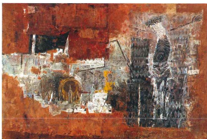
聖家族 [1960 117.0×194.0cm]