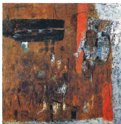
子供の一隅 [1965 130.3×130.3cm]