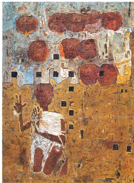
黄色い墓標 [1962 194.0×117.0cm]